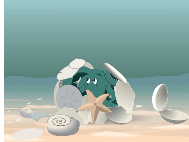
Un polp amagat sota les petxines.

Algunes vegades, els polps poden fins i tot utilitzar les petxines per a amagar-se. Arrepleguen les petxines amb les seues ventoses i després emboliquen el seu cos amb els tentacles, deixant només les petxines a la vista. En passar, els depredadors pensen que només hi ha un munt de petxines.