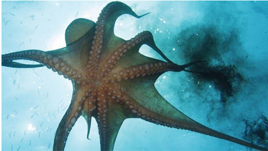
Un polp expulsa tinta per a escapar del perill.