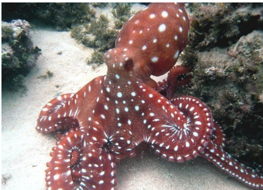
Un polp espanta els depredadors amb les seues taques.