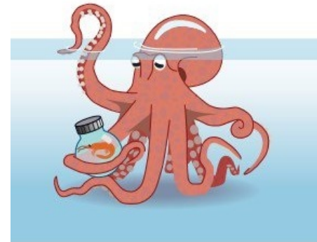
Frieda obrint un pot de menjar.

En un centre marí dels Estats Units, un polp anomenat Squirt va aprendre a pintar. Ho va aconseguir movent unes palanques que disparaven pintura en un llenç. L'«art» es venia per a finançar el manteniment de la peixera del polp.