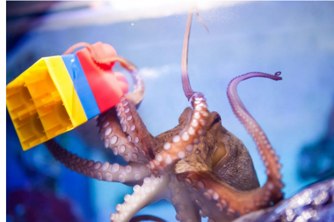
Un polp jugant amb un joguet en la seua peixera.

En un aquari dels Estats Units, un polp anomenat Sammy es divertia jugant amb una pilota de plàstic que podia muntar-se girant les dues meitats. El seu cuidador posava menjar dins de la pilota i Sammy l'obria, se la menjava, i tornava a tancar-la quan havia acabat.